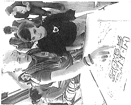
Ausbildungsseminar für Gruppenleiter einer Jugendorganisation.